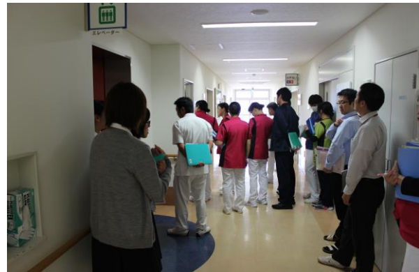
※病院内をラウンドし、評価を受けている様子

受審することで、よくできている部分とまだ十分でない部分を病院全体で見直し、より一層充実した診療を目指したいと思っています。