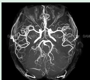
■ 頭部 MRA