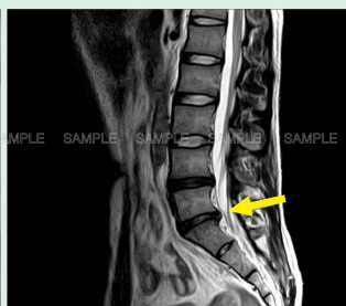
■ 腰椎椎間板ヘルニア