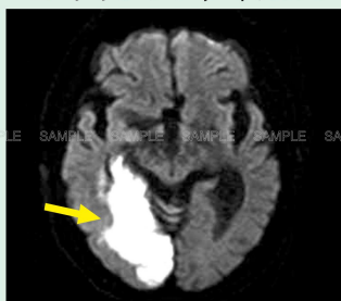
■ 頭部 脳梗塞