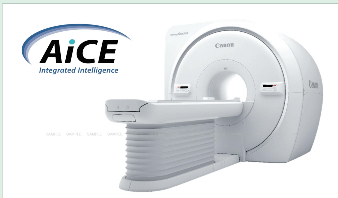
■ キヤノンメディカルシステムズ製 1.5T DLR- MRI